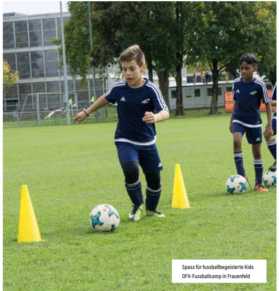
Spass für fussballbegeisterte Kids OFV-Fussballcamp in Frauenfeld