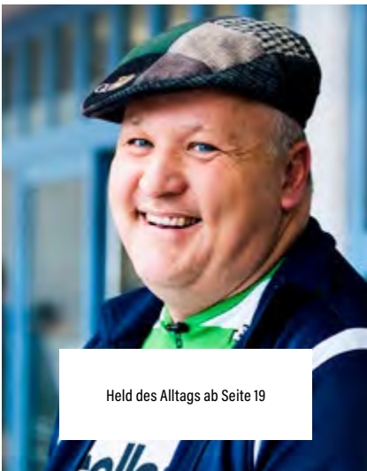
Held des Alltags ab Seite 19