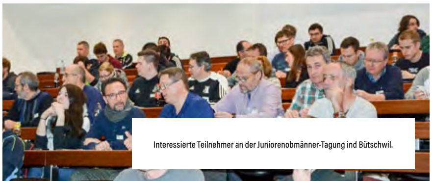
Interessierte Teilnehmer an der Juniorenobmänner-Tagung in Bütschwil.