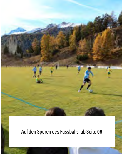
Auf den Spuren des Fussballs ab Seite 06