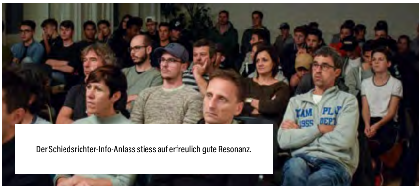
Der Schiedsrichter-Info-Anlass stiess auf erfreulich gute Resonanz.