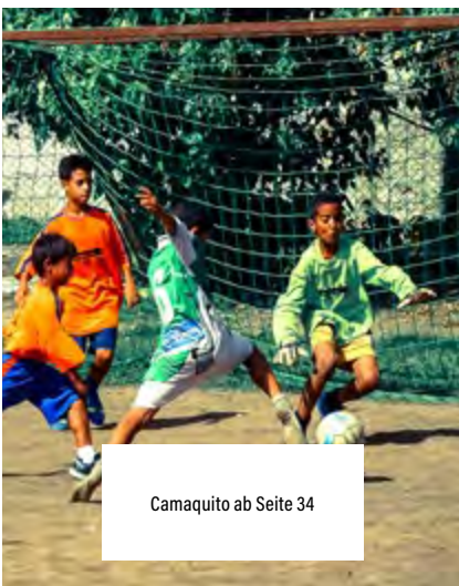
Camaquito ab Seite 34